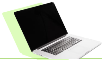
Furto di laptop

Lavorare nei luoghi pubblici rende particolarmente vulnerabili a questi rischi: