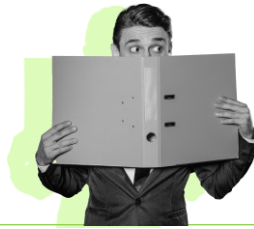
Navigazione a spalla