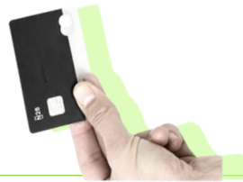
הונאת דוא"ל עסקי

קבלת הרשאה להעברת כספים הופכת אותך לפגיע במיוחד לסיכונים אלו: