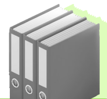
שיתוף מידע מסווג