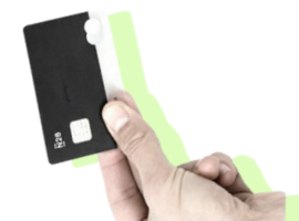
התקפת דוא"ל עסקי