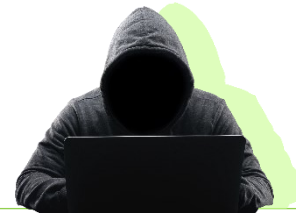
הונאת התחזות לספק